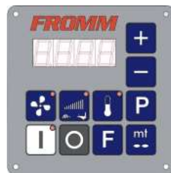
Painel de controlo fácil de operar